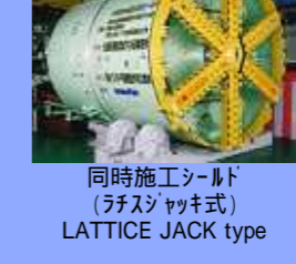
同時施工シールド (ラチスジャッキ式) LATTICE JACK type