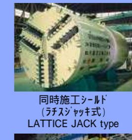
同時施工シールド (ラチスジャッキ式) LATTICE JACK type