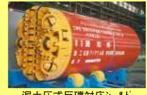
泥土圧式巨礫対応シールド EPB type Shield for boulder