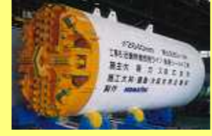
泥土圧式巨礫対応シールド EPB type Shield for boulder