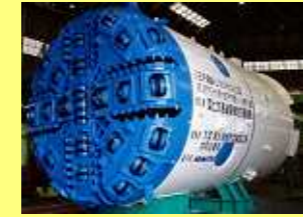
泥水式ハイブリッドシールド 33号機 Hybrid Shield (Slurry type No.33)