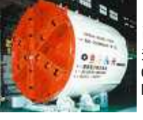
高水圧対応泥土圧式シールド (CPS工法) Chemical Plug Shield Method