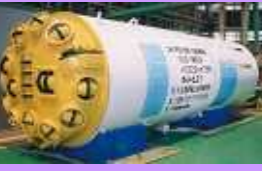
No.43 ダブルシールド型 TBM (下水道トンネル) No.43 Double Shield type TBM (For Sewerage)