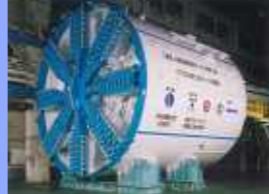
長距離施工シールド (格納式段差ビット装置搭載) Long range construction (Retractable Step Bit System)