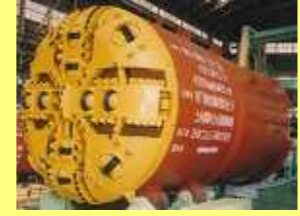
泥水式巨礫対応シールド Slurry type Shield for boulder