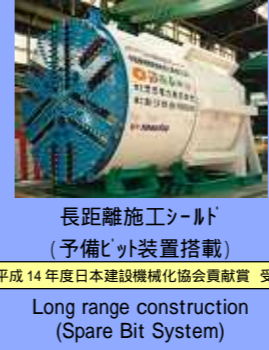
長距離施工シールド (予備ビット装置搭載) Long range construction (Spare Bit System) 平成14年度日本建設機械化協会賞 受賞