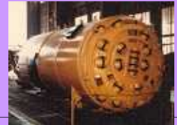
No.14 全地質対応型 TBM