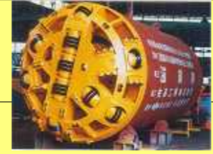
泥土圧式巨礫対応シールド EPB type Shield for boulder