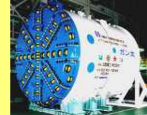
泥水式ハイブリッドシールド 26号機 Hybrid Shield (Slurry type No.26)