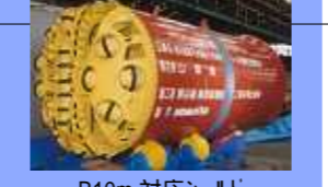
R10m 対応シールド EPB type (R10m)