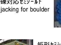
巨礫対応セミシールド Pipe jacking for boulder