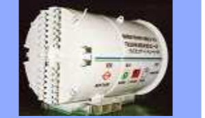
R10m 対応シールド Slurry type (R10m)