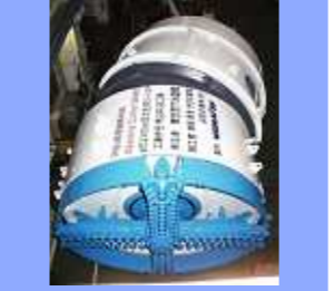
R8m 対応シールド EPB type (R8m)