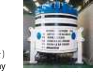
垂直掘進機 Vertical Boring Machine