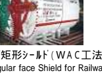
大断面矩形シールド (WAC工法) Rectangular face Shield for Railway (Wagging Cutter Shield Method)