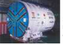
地中接合シールド Mechanical underground connection