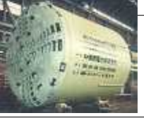
海底掘削シールド Submarine Shield