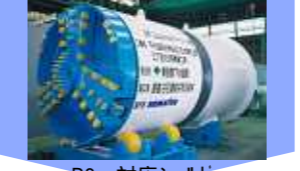
R8m 対応シールド EPB type (R8m)