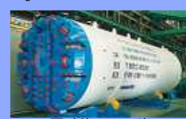
同時施工シールド (F-NAVIシールド工法) Front-navigate Shield Method