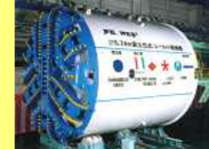
泥土圧式ハイブリッドシールド 43号機 Hybrid Shield (EPB type No.43)