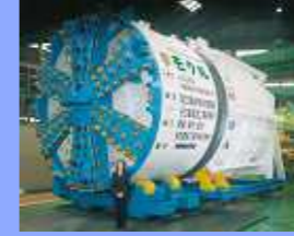
長距離施工シールド (リレービット搭載) Long range construction (Relay Bit System)