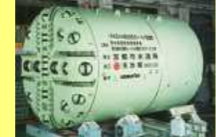
泥水式ハイブリッドシールド 16号機 Hybrid Shield (Slurry type No.16)