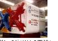
親子シールド MS Shield Method 平成8年度科学技術庁 第58回注目発明