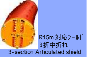
R15m 対応シールド 3折中折れ 3-section Articulated shield