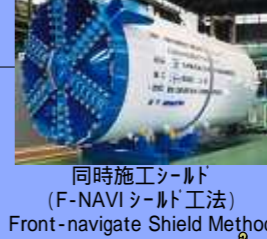
同時施工シールド (F-NAVIシールド工法) Front-navigate Shield Method 平成15年度国土技術開発賞 最優秀賞 受賞