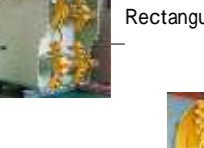
矩形セミシールド Rectangular face Pipe jacking