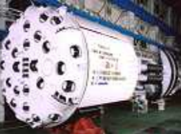
No.37 改良オープン型 TBM (道路トンネル) No.37 Improved Open type TBM (For High Way Tunnel)

No.36 斜坑 TBM (全断面切り上がり方式) No.36 Double Shield type TBM For Hydro Plant Inclined Shaft (Full Face Raise)