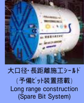
大口径・長距離施工シールド (予備ビット装置搭載) Long range construction (Spare Bit System)