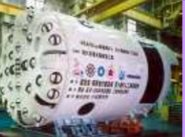
No.27 ダブルシールド型 TBM (導水路トンネル) No.27 Double Shield type TBM

1980 No.24 オープン型 TBM (道路トンネル) No.24 Open type TBM (For High Way Tunnel)