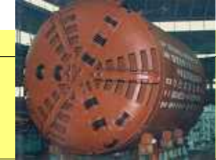
泥水式ハイブリッドシールド 4号機 Hybrid Shield (Slurry type No.4)

No.44 斜坑 TBM (リング方式) No.44 Open type TBM For Hydro Plant Inclined Shaft (Reaming Down)