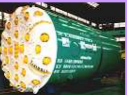
No.34 ダブルシールド型 TBM (道路トンネル) No.34 Double Shield type TBM (For High Way Tunnel)

No.29 斜坑 TBM (リング方式) No.29 Open type TBM For Hydro Plant Inclined Shaft (Reaming Down)