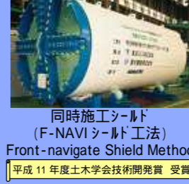
同時施工シールド (F-NAVIシールド工法) Front-navigate Shield Method 平成11年度土木学会技術開発賞 受賞