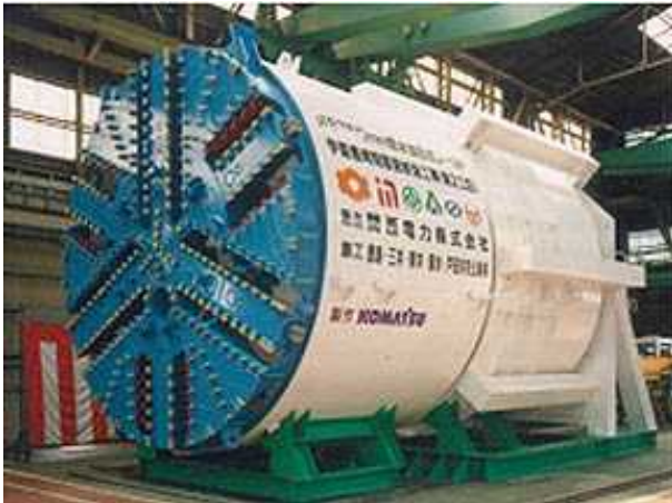
地中接合対応 5750mm 泥水加圧式シールド