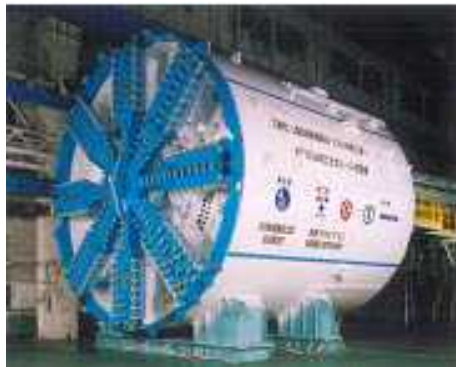
7150mm (格納式段差ビット装置搭載 河川横断対応)