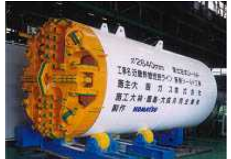
2640mm (巨礫・長距離対応)