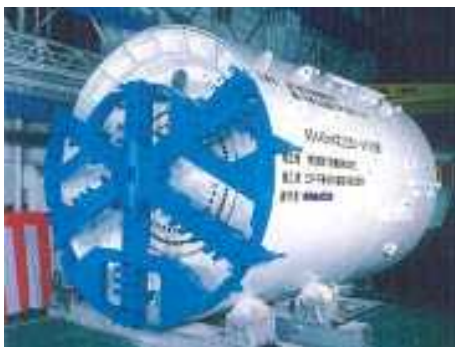
5440mm (地中障害物撤去対応)